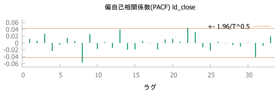
図1 NYSE 総合指数（週次）の対数階差のコレログラム